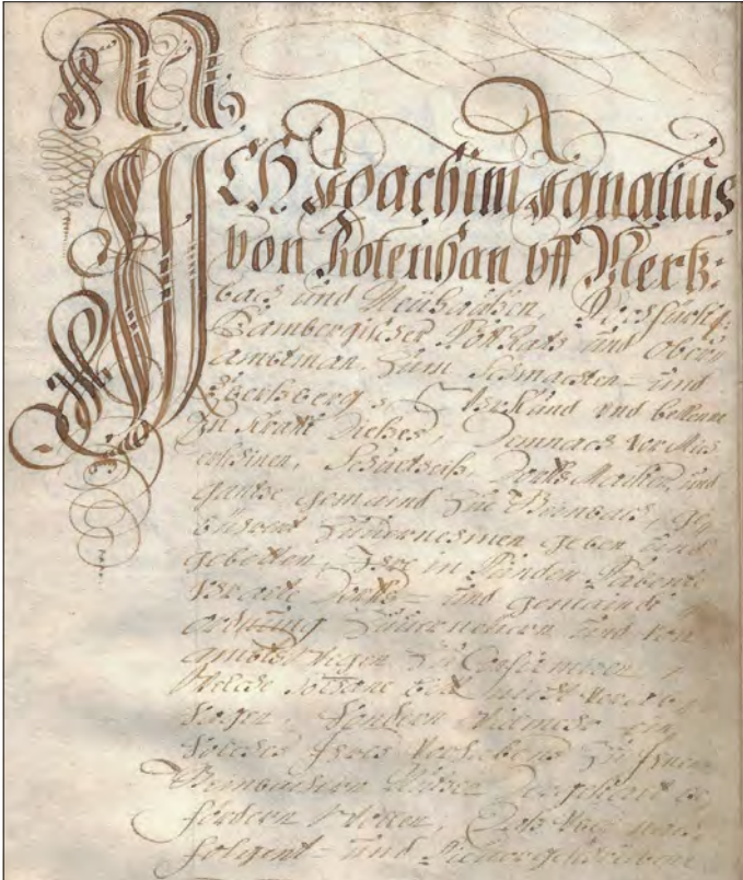
Titelblatt der Steinbacher Dorfordnung von 1689.