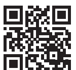
Alfons Hartlieb, 1. Bgm.