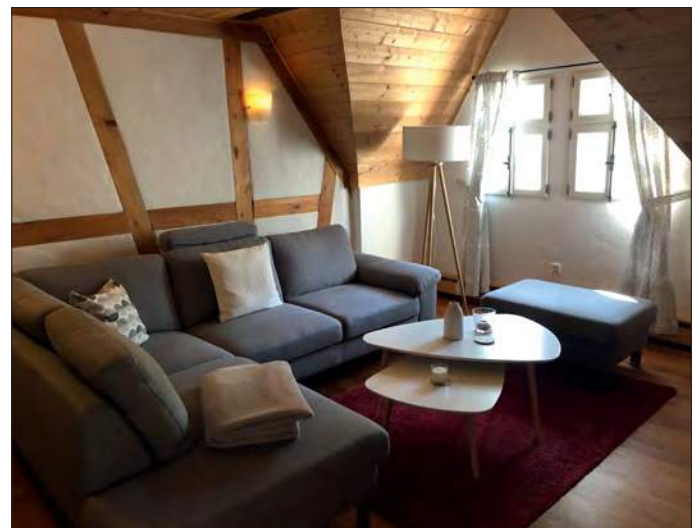
Ferienhaus Bramberger Mühle – moderne und komfortable Einrichtung in den historischen Gemäuern einer alten Mühle

Sprechen Sie uns an: Sie erreichen uns persönlich in der Tourist-Information am Hofheimer Marktplatz, Marktplatz 1, 97461 Hofheim i.UFr., telefonisch unter 09523-5033710 oder per E-Mail an info@hassberge-tourismus.de .