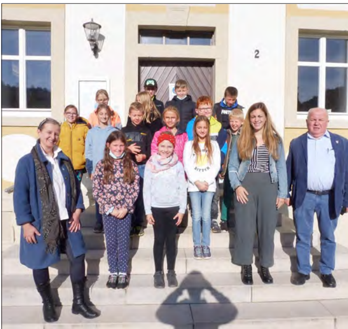
Text: Freter

Bei einer Führung durch das Verwaltungsgebäude erhielten die SchülerInnen einen Einblick in das Tagesgeschäft einer Verwaltung. Besonders fasziniert waren sie davon, wie viele Mitarbeiter dafür notwendig sind. Ein Highlight war sicherlich auch, dass die Kinder Gelegenheit hatten einmal auf dem Bürostuhl das Bürgermeisters Platz zu nehmen. Wer weiß, vielleicht könnte dies irgendwann einmal der Arbeitsplatz eines Schülers oder einer Schülerin der Klasse 4a werden.