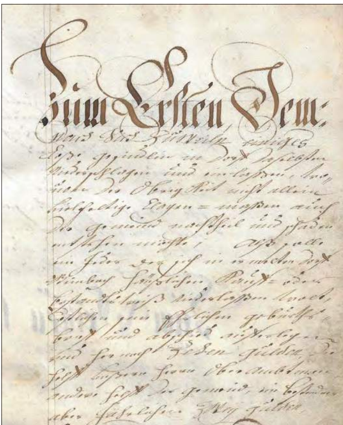
Erster Punkt der Dorfordnung.

Im Oktober 1689 erhielt Steinbach eine neue Ordnung, um die „in Händen habente uhralte Dorffs- und Gemeinde-Ordnung Zu erneuern“, die von Joachim Ignatius von Rotenhan unterschrieben und mit seinem Siegel versehen wurde. Diese Ordnung regelte in 17 Punkten das Leben im Dorf und ersetzte die alte Ordnung, die leider nicht mehr vorhanden ist.