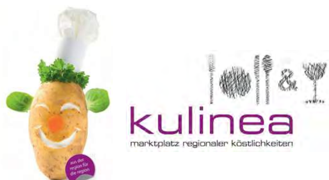
Die Logos der kulinea

Weitere Informationen rund um die Messe sind unter www.kulinea.hassberge.de erhältlich. Nach dem Ausfall der kulinea im vergangenen Jahr ist die Vorfreude auf die Messe 2023 auf Seiten der Organisatoren nun umso größer. Die Kreisentwicklung freut sich auf viele Bewerbungen, um wieder ein prall gefülltes Schatzkästchen regionaler Köstlichkeiten bieten zu können.